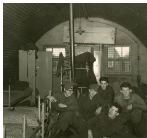
'Kampement A' – Legerplaats Oirschot – Generaal-majoor De Ruyter van Steveninckkazerne De eerste jaren van de kazerne bij Oirschot

Aan weerszijden van de oude dijk tussen Oirschot en Eindhoven strekt zich vier kilometer lang de afrastering van een groot militair complex uit. Ongeveer halverwege ligt de toegangspoort van de Generaal-majoor De Ruyter van Steveninckkazerne. Aan de oostzijde schurkt het moderne rijopleidingscentrum van Defensie tegen het kazernehek aan. De overige honderden hectaren van het complex zijn in gebruik als oefenterrein voor de hoofdgebruiker van dit defensie terrein: de 13e Gemechaniseerde Brigade (13 Mechbrig). Het kazerneterrein is tegenwoordig volgebouwd met legeringsgebouwen, loodsen, werkplaatsen, instructielokalen en andere faciliteiten voor de brigade, waar nog geen zeventig jaar geleden een ongerept heidegebied lag. Dit artikel verkent de eerste jaren van dit defensiecomplex.