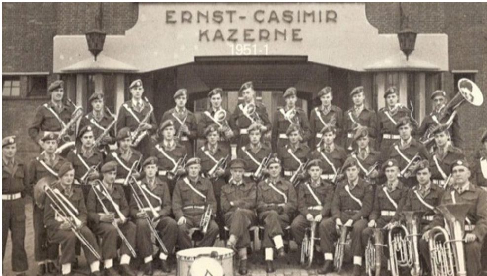
De eerste lichter van muzikanten van fanfarekorps Limburgse Jagers in februari 1951