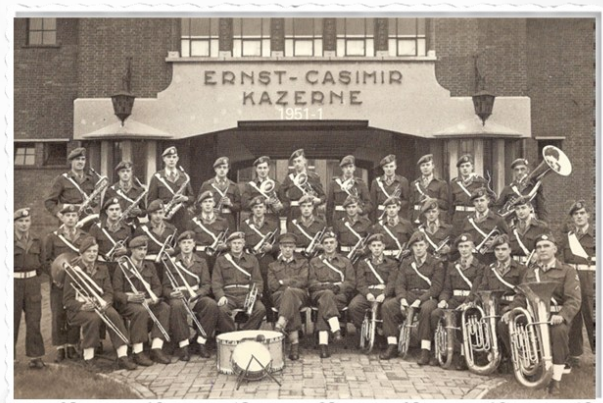
De eerste foto van het muziekkorps Limburgse Jagers, kort na oprichting in 1951

Het Reünie-Orkest Limburgse Jagers viert zijn 75-jarig bestaan. Dat betekent al driekwart eeuw zwaaien met stralend witte zakdoeken, al vanaf de eerste tonen van de Limburgse Jagersmars.